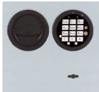
DFS Schloß mit mechanischer Revision Art. Nr. 59287