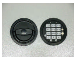
DFS Schloß Art. Nr.: 59281, 59282 und 59283