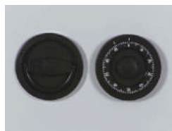
ZK Schloß Art. Nr.: 59280