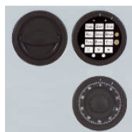
DFS Schloß mit mechanischer Revision Art. Nr. 59288

Bis 10 Kurz Waffen und Munition ohne räumliche Trennung (Schrank muss verankert werden!).