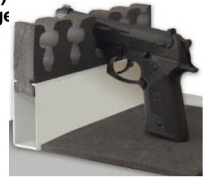
Waffenhalter auf Fachboden

Art. Nr. 59270 8 Waffenhalter am Tresorboden (siehe nebenstehenden Ausklinker) 1 verstellbarer Fachboden zur Ablage